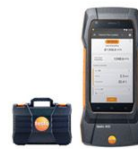
testo 400 เครื่องวัดคุณภาพอากาศ ภายในอาคาร