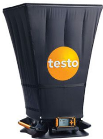
testo 420 เครื่องวัดปริมาณการไหลของอากาศ